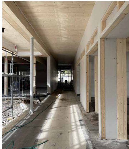
Baustelle Nov 25